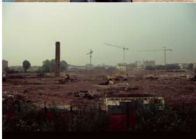
© Knut Åsdam / BONO. Bilder fra Filter City (2003).

tar og innredning. Derigjennom gjorde Matta-Clark det tydelig at privatliv ikke skaper individualitet, men isolasjon: Alle levde lignende liv i lignende leiligheter, men forble allikevel usynlige for hverandre. Følgene av visualiseringen av likhet og isolasjon er dypt politiske og tydeliggjør en overgang fra praksis til kritikk til revolusjon i hverdagslivet. 6