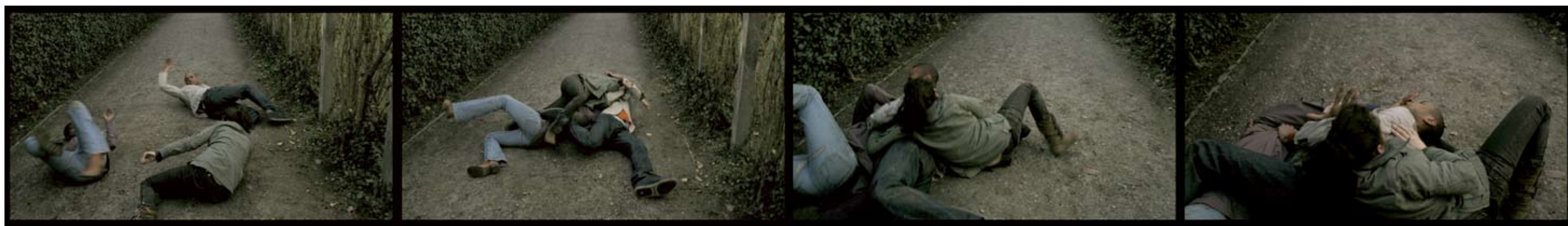
© Knut Åsdam / BONO. Bilder fra Finally (2006).